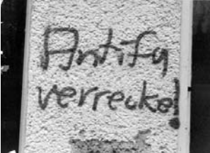
»Antifa Verreckt« - Nazischmiererei am S-Bhf Baum-schulenweg.