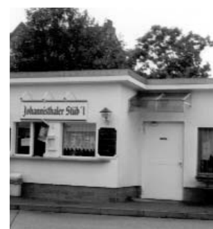
Das Johannisthaler Stüb´l am Busbahnhof Schöneweide ist regelmäßiger Treffpunkt der BA-SO und anderen Treptower Neonazis.