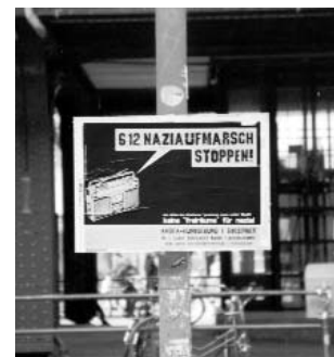
Ein Plakat gegen den Naziaufmarsch am 6. Dezember 2003 in Schöneweide.