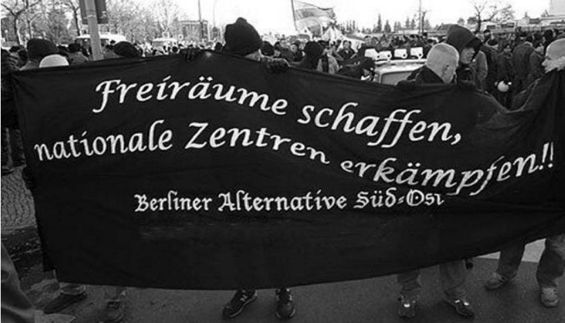
Transparent der »Berliner Alternative Süd-Ost« beim Naziaufmarsch in Rudow im Dezember 2003.