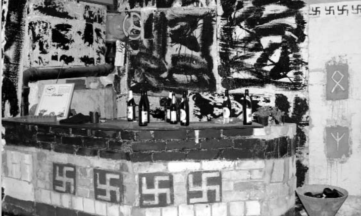
Der Versuch eines »Nationalen Jugendzentrum« - besser bekannt als die »Wolfsschanze«. BA-SO-Mitglieder betranken sich dort mit bis zu 15 Nazis und veranstalteten dort illegale Feiern.