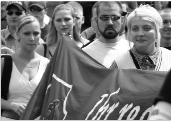
»Ihr redet - wir handeln« - das anti-intellektuelle Transparent der BA-SO ist regelmäßig und bundesweit auf Naziaufmärschen zu sehen. Hier in Eisenhüttenstadt.